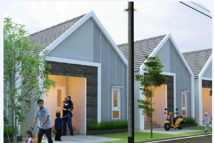
ROYAL SUNNY, TIPE 36/81 M2

JL. GERILYA, PERADAPAN KARYA DISAMPING MESJID AL HARIS