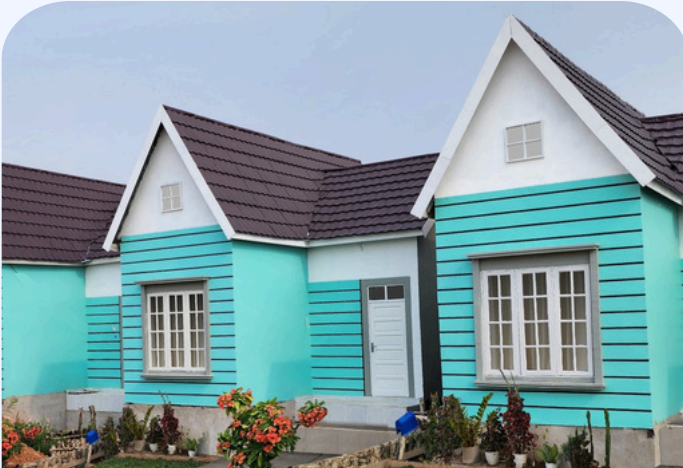
GREEN SUNNY LIVING TIPE 36/84M2

JL. AMD, PEMURUS, DEKAT PUSKESMAS BERUNTUNG RAYA