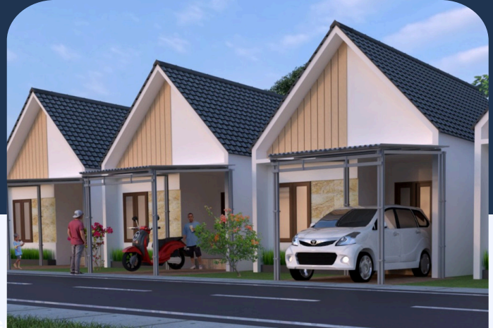
D'SUNNY CLUSTER TIPE 36/74 M2

JL. AMD, PEMURUS, DEKAT PUSKESMAS BERUNTUNG RAYA