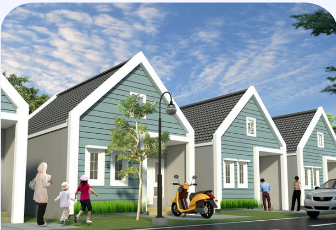
D'SUNNY EMERALD, TIPE 36/73 M2

JL. GERILYA, PERADAPAN KARYA (DISAMPING SMK NU)