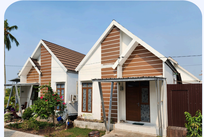
GREEN SUNNY ESTATE TIPE 36/73 M2

JL. GERILYA, PERADAPAN KARYA (DISAMPING SMK NU)