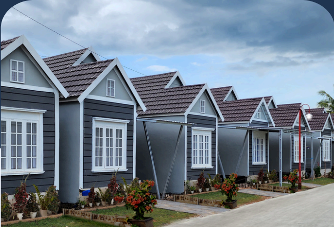
D'SUNNY REGENCY TIPE 36/74 M2

JL. AMD, PEMURUS, DEKAT PUSKESMAS BERUNTUNG RAYA